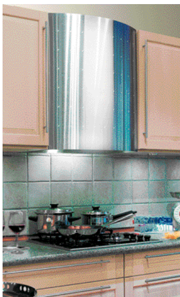
Inomhusmiljön hemma är viktig för hur vi mår.

– Öppenheten för att diskutera detta ökar men det största problemet med just radon är faktiskt att väldigt få människor vill veta, man är helt enkelt rädd för att få veta att det hus man bor i faktiskt är farligt. Det man inte vet, lider man ju inte av.